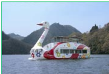
相模湖遊覧船乗船

9:00 相模湖駅集合⇒相模湖遊覧(9:20~10:20)⇒佐野川 (10:50~11:40)⇒昼食(12:00~13:00)⇒農産物 収穫体験(13:30~15:30)⇒やまなみ温泉(15:50~1 7:30)⇒藤野駅解散(18:00)