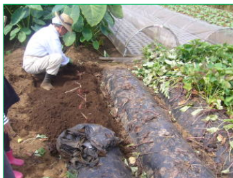
藤野園芸ランド 収穫体験