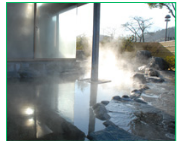
やまなみ温泉入浴

藤野駅からは、車にて各地へご案内します。 昼食は地元無農薬野菜を中心にした料理です。 柚子、農産物のお土産付きです。*農産物は時期により種類は異なります。