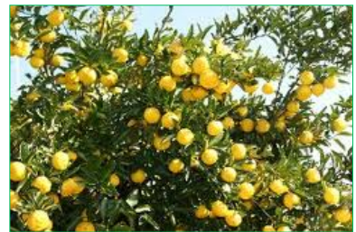
藤野名産柚子もぎ取り